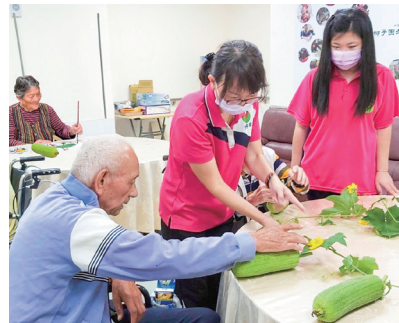
▲ 中高齡員工帶領長輩藝術創作