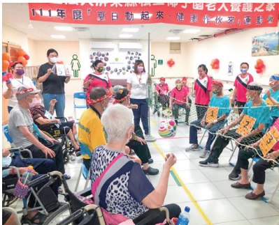
▲ 中高齡員工設計長輩運動會活動

椰子園積極聘用中高齡員工加入照護行列，也為中高齡者量身打造職能提升教育、退休準備課程，推動彈性上班工時、優質員工選拔表揚、環境空間再設計及人體工學設施設備擴充，運用自身長照一條龍服務之資源優勢，打造多元的中高齡就業方式，營造一個讓員工無後顧之憂的友善職場，讓中高齡及高齡者職涯光芒再現。