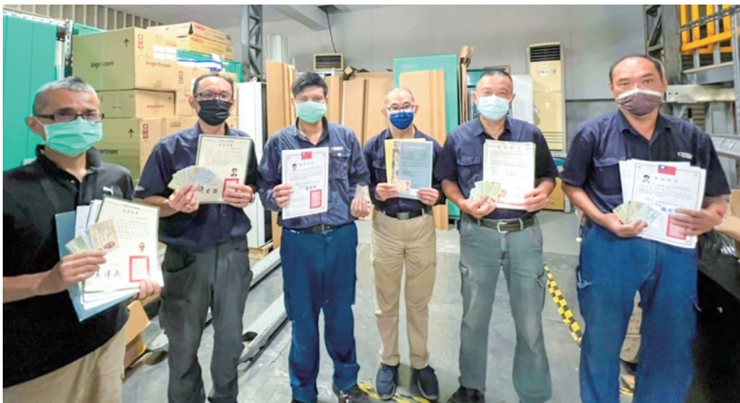
▲ 積極培養中高齡員工考取證照

誠諾工程也重視員工家庭和諧，定期舉辦聚餐活動及員工旅遊，不只有員工能參與，更鼓勵中高齡員工眷屬免費參加，享受工作及家庭共融的美好時光。