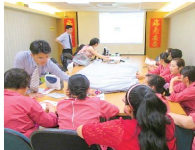
▲ 中高齡員工參與混齡世代教育訓練課程