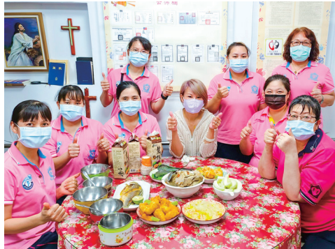
▲ 中高齡員工用餐合照