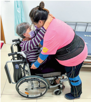
▲ 中高齡員工使用輔具抱起長輩

為保障中高齡及高齡工作者安全及健康，長生老人每年為工作人員進行職業安全衛生教育訓練，亦主動推動防火、防洪，健全的電供體系等的風險管理機制與措施。平時也有可以一起圍桌的溫馨用餐環境，並由營養師擬定循環菜單，午餐後也提供45歲以上中高齡員工臥鋪休息室與摺疊躺椅，改善午休方式，提升樂齡員工產值。