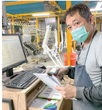
▲ 為中高齡員工換購新的電腦螢幕