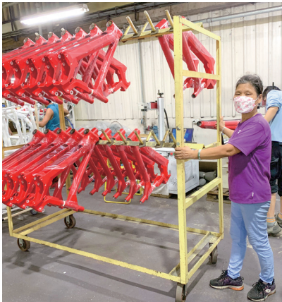
▲ 中高齡員工使用推車輔具工作

太平洋自行車於廠內建置兒童照顧區，讓有需求的員工能夠安置孩子，放心工作；另鼓勵員工運動、參與公益家庭日活動等，免費讓員工及眷屬參加，支持員工工作、家庭、健康的全方位照顧。