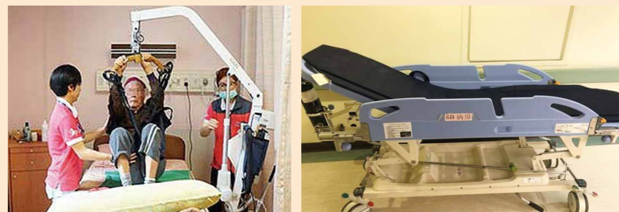
使用搬運推床和移位機，輔助員工進行醫護工作，減少職業傷害。